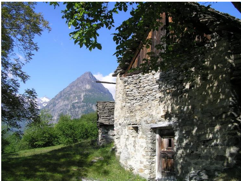
Figura 2 Le tipiche malghe di Valdo con il Seehorn e i quattromila della valle di Saas

L'escursione è di media lunghezza ma con tratti ripidi, faticosi e talvolta esposti, sebbene dotati di cavi di sicurezza (non è necessaria attrezzatura da ferrata).