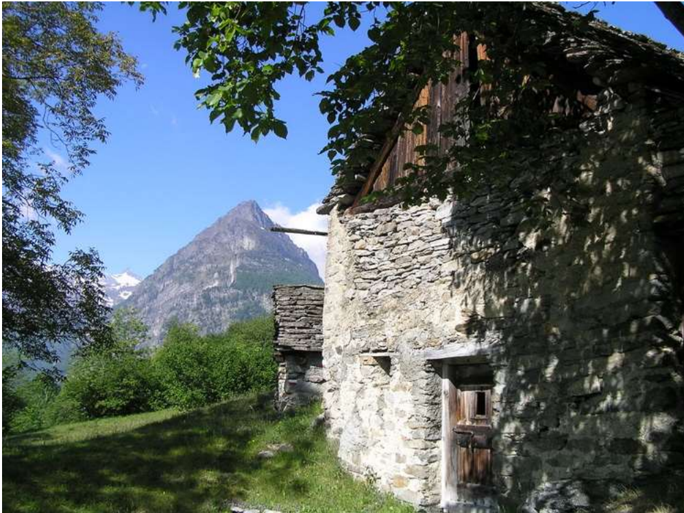
Figura 2 Le tipiche malghe di Valdo con il Seehorn e i quattromila della valle di Saas sullo sfondo

L'escursione prevede tratti ripidi, faticosi e talvolta esposti, sebbene protetti con cavi di sicurezza (non è necessaria attrezzatura da ferrata).