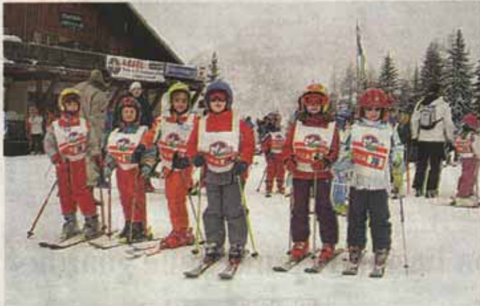
Alcuni dei bambini che hanno partecipato al corso di sci organizzato da Club Escursionisti Arcoresi

ARCOREE (Ilva) Sabato 3 febbraio scorso si sono svolti a Chiesa Val Malenco i campionati di sci e snow board della CEA (Club Escursionisti Arcoresi), associazione giunta al 45° anno di fondazione. I campionati arcoresi che si sono svolti in una splendida giornata di sole, hanno visto la partecipazione di ben 110 concorrenti dai 6 ai 80 anni, allievi dei corsi di sci, amatori e AVIS. Si sono dati tutti battaglia davanti ad un folto e caloroso pubblico.